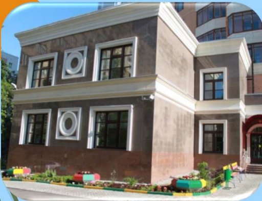
Улица Алабяна, дом 13, к. 2.