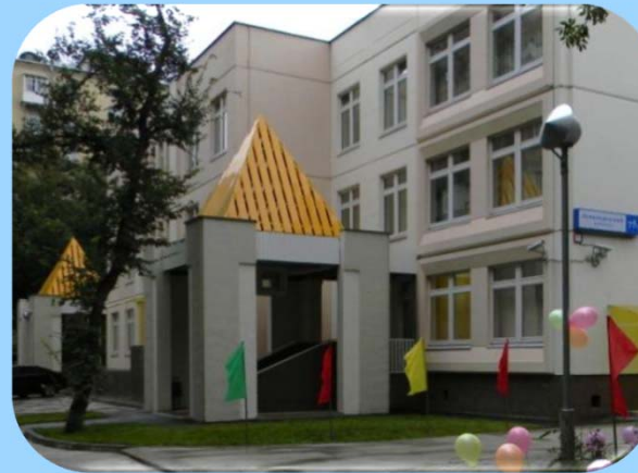
Дошкольное отделение № 2